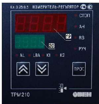
Рис.6. Лицевая панель измерителя-регулятора TPM210.

4.5.1 Внешний вид лицевой панели измерителя-регулятора изображен на рис.6.