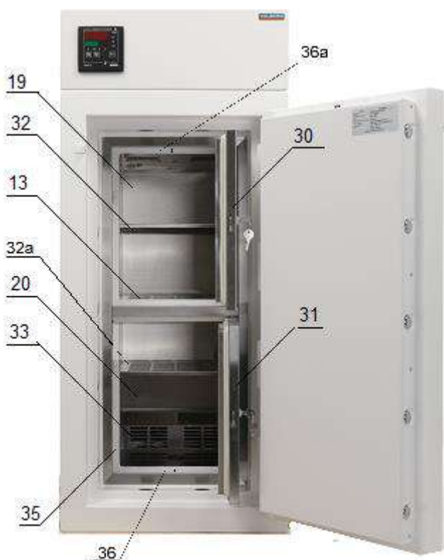
Рис.2. Сейф-термостат медицинский TS-3/50.

4.2.6 На правой боковой стороне кожуха блока электроники размещена панель с элементами управления электропитанием изделия и вентилятором для сброса в атмосферу тепла, выделяемого блоком управления сейфа-термостата.