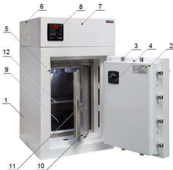
Рис.1. Общий вид сейфа-термостата медицинского.

4.1.1 Рабочая камера термостата, с емкостью хранения 25 литров оснащена полкой (12), выполнена из нержавеющей стали и отделена от корпуса сейфа высокоэффективным теплоизолирующим материалом. Порт рабочей камеры отделен от полезного объема рамкой из полистирола, которая снабжена кнопкой включения звуковой сигнализации, срабатывающей через 22 секунды после открывания ее двери.