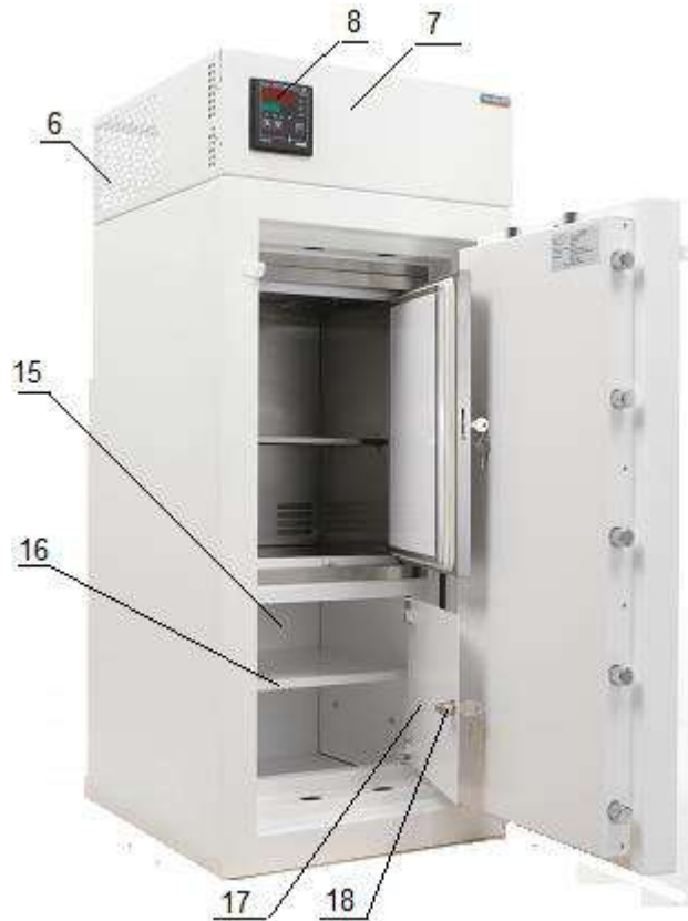
Рис. 3. Сейф-термостат с трейзером.

4.3.1 На верхней панели (рис.3) базового сейфа установлен электронный блок изделия (6), который включает в себя блок управления (7) с измерителем регулятором (8);